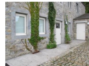
Ingang van de microgîte PBM