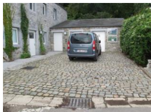
Parkeerplaats voor PBM naast de ingang van de microgîte