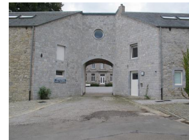
Toegangsportaal van het eigendom

GPS: Lengtegraad: 4.5895702 Breedtegraad: 50.0903454