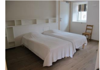
Slaapkamer voor PBM