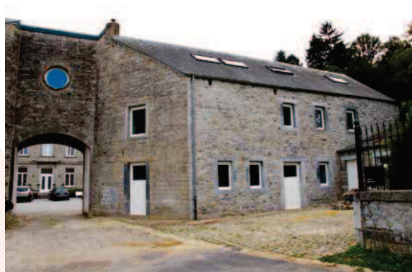
▲ APRÈS Un gîte avec une capacité d'accueil de 50 personnes et deux micro-gîtes.