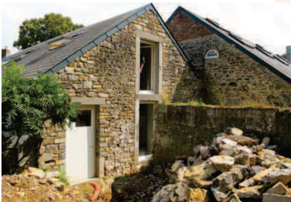
▲ PENDANT Rénovation de la façade arrière.

isolants issus de la pétrochimie. Pour maintenir une performance énergétique équivalente, il a dès lors fallu augmenter l'épaisseur des matériaux isolants ce qui a bien sûr eu des conséquences sur la conception." Les sols ont dû être creusés pour permettre la pose d'une couche importante de panneaux de liège expansé tout en restant à niveau du sol extérieur pour permettre l'accès généralisé aux PMR. La toiture et les murs, quant à eux, se sont vus poser du côté intérieur une contre-cloison perspirante composée d'une ossature bois isolée en deux couches : cellulose et fibre de bois. Pour la séparation des espaces au rez-de-chaussée, ce sont des cloisons en briques de terre crue qui ont été réalisées, un matériau ayant une grande inertie et qui, en absorbant la chaleur, permet d'éviter un réchauffement rapide des pièces en été et leur refroidissement en hiver. Des châssis en mélèze ont encore été installés. Enfin, "un audit énergétique a été réalisé par le bureau d'étude Eureka pour maximiser les choix en termes de système de chauffage, de ventilation et d'isolation", explique la propriétaire.