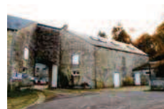
▲ AVANT Ancienne ferme en carré.