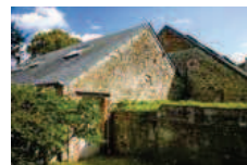
▼ AVANT Façade arrière avant rénovation.

Aujourd'hui, après cette importante transformation de l'aile de l'ancienne ferme, trois gîtes ruraux seront bientôt prêts pour accueillir un public soucieux du respect de l'environnement et désireux profiter de cette belle région au sein de la province de Namur.